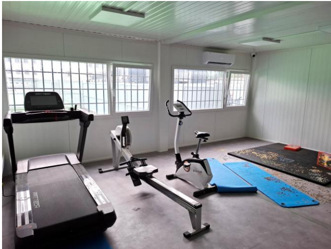
8 pav. TOG būrio užimtumo patalpos Vilniaus kalėjime.

metu TOG būryje buvo 12 vietų, gyveno 7 nuteistieji. Administracijos teigimu, gyventi šiame būryje norinčių nuteistųjų yra daug, tačiau nuteistųjų atranka vyksta vertinant motyvaciją ir kitus veiksnius. Kalbintų nuteistųjų teigimu, jie patenkinti gyvenimo sąlygomis naujai įrengtame būryje, tarpusavyje pasiskirto įvairius buitines darbus, kartu leidžia laisvalaikį. Nors jiems yra žinomos neformalios nuteistųjų subkultūros taisyklės, tačiau, anot kalbintų nuteistųjų, TOG būryje jomis nesivadovauja, jaučiasi saugiai.