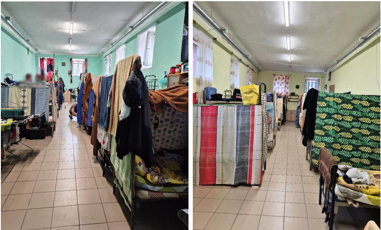
1 pav. Bendrabučio tipo gyvenamosios patalpos (sekcijos) Marijampolės kalėjime.

2.1.2. Alytaus ir Marijampolės kalėjimuose nuteistieji skundėsi blakių paplitimu bendrabučio tipo patalpose, kuriuose buvo medinės grindys. Vienas nuteistasis Alytaus kalėjime interviu