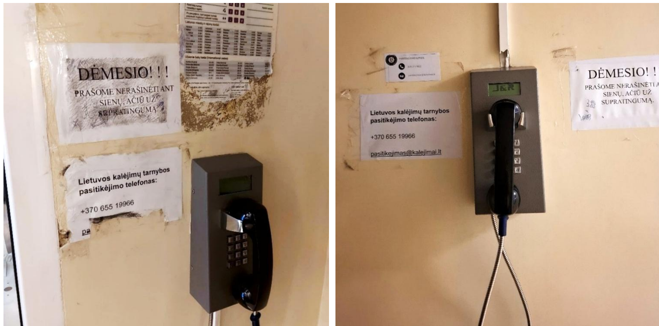
7 pav. Nuteistiesiems skirti taksofonai Marijampolės kalėjime.

Nuteistieji turėjo galimybę teikti skundus ir prašymus raštu ir šia teise naudojosi, tačiau tai nėra saugus kanalas pranešimams apie galimus smurto atvejus teikti. Tokie skundai arba prašymai negali būti anoniminiai ir turi būti įteikiami pareigūnams tiesiogiai. Nuteistiesiems skirtų anonimių skundų dėžučių tikrintuose kalėjimuose nebuvo. Teikiant rašytinius skundus ir prašymus taip pat nebuvo aiškių konfidencialumo garantijų ir pranešėjų apsaugos mechanizmų.