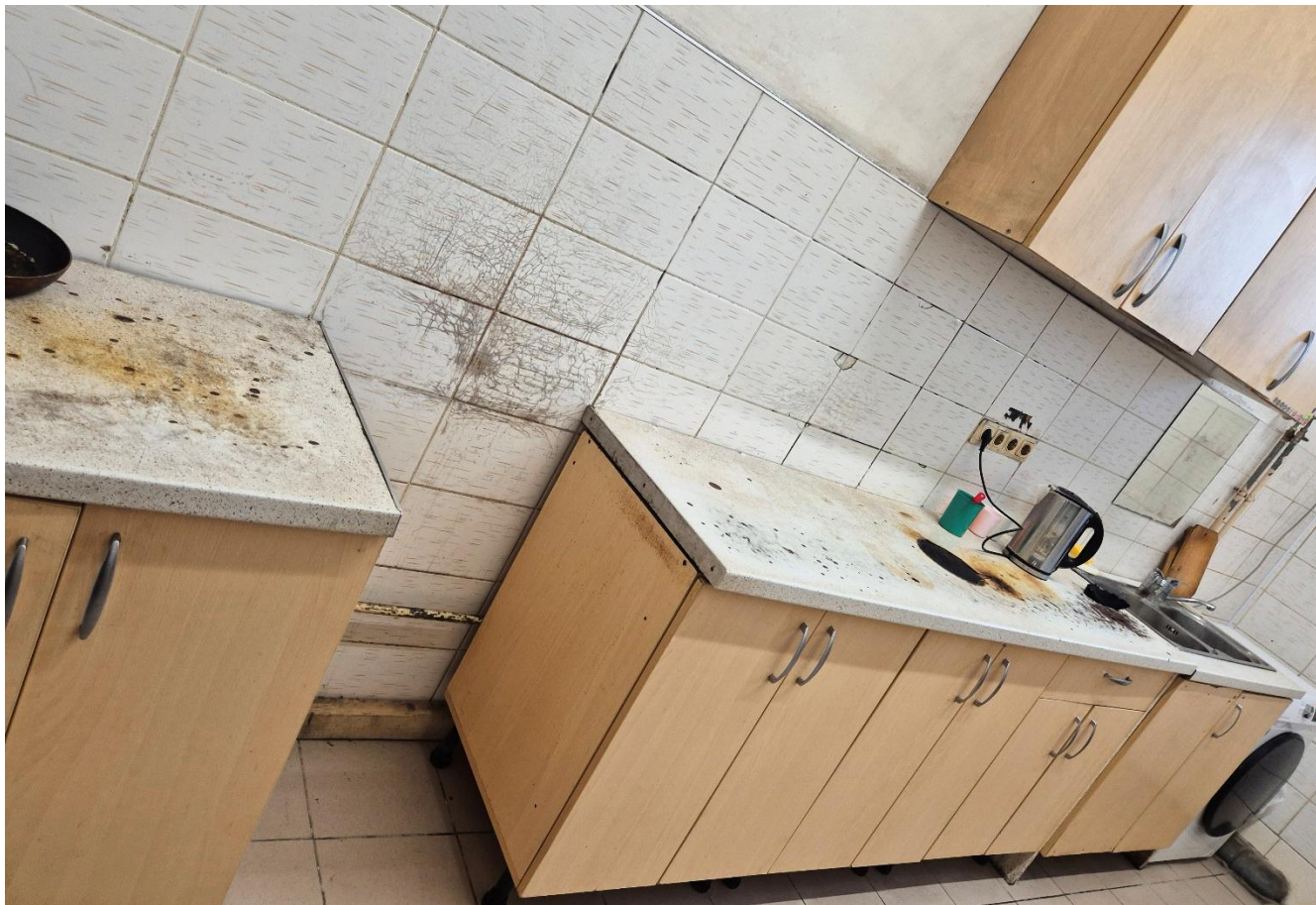
4 pav. Bendrabučio tipo patalpų virtuvėlė kambarys Marijampolės kalėjime.

robangų krosnele, numatytas pagal poreikį. Patikrinimo metu skyrėsi ir bendrabučio tipo patalpose gyvenančių būrių virtuvėlių įrengimas: ne visose buvo veikiančios viryklės ar stalai, įranga buvo sulūžusi ir nudėvėta. Patalpų aprūpinimo normų taisyklėse laisvalaikio (užimtumo) kambariams ir virtuvėlėms numatyti privalomi aprūpinimo reikalavimai yra visiškai minimalūs ir vargu ar atitinka humanizmo principą, įtvirtintą BVK 4 straipsnio 1 dalies 4 punkte. Nors kalėjimai, laisvalaikio kambarius ir virtuvėles įrengdami bei aprūpindami tik Patalpų aprūpinimo normose numatytais privalomais daiktais, formaliai nepažeidžia LKT vidaus teisės aktų reikalavimų, vis dėlto toks minimalus aprūpinimas, vertinant jį žmogaus orumo ir socialinės reabilitacijos tikslų kontekste, laikytinas nepakankamu. Atsižvelgiant į ribotas nuteistųjų užimtumo ir įsidarbinimo galimybes kalėjimuose (apie tai plačiau – šios ataskaitos 2.5 punkte), taip pat į tai, kad didelė dalis nuteistųjų vis dar apgyvendinama bendrabučio tipo patalpose, kuriose viename būryje gyvena keliasdešimt asmenų, tikslinga užtikrinti, jog laisvalaikio kambariai ir virtuvėlės būtų aprūpintos visais arba dauguma Patalpų aprūpinimo normose numatytų baldų ir daiktų. Toks aprūpinimas sudarytų prielaidas realiai įveikinti būriuose esančias bendras erdves,