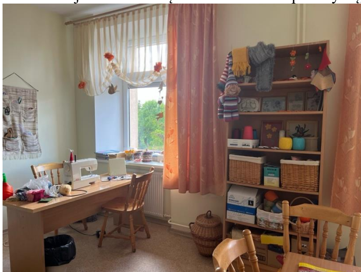
pav. 7 Siuvimo užimtumo patalpos.

Dvaro ir IV skyriuose apgyvendinta daugiau savarankiškų asmenų, todėl taip pat koncentruojamasi ne tik į savarankiškumo palaikymą, bet ir ugdymą. Šių skyrių socialinio darbo 2023 m. planuose ir 2022 m. ataskaitose akcentuojamas skalbimo įgūdžių ugdymas, gyvenamų kambarių ir aplinkos tvarkymas, apsipirkimo įgūdžių ugdymas.