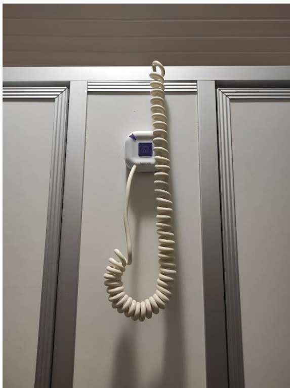
pav. 3 Pagalbos kvietimo sistema.

3.3.2.1. Patikrinimo metu PKS buvo įrengta ir veikė visuose Globos namų skyrių gyvenamuosiuose kambariuose. Intensyvios slaugos, II, III, IV ir Specialiojo skyrių gyvenamuosiuose kambariuose PKS kvietimo mygtukų buvo tiek, kiek viename kambaryje gyveno gyventojų. Vis dėlto, daugumoje tikrintų minėtų ir taip pat Dvaro skyriaus kambarių, PKS mygtukai buvo perkelti į gyventojams (-oms) nepatogias bei kritiniu atveju sunkiai pasiekiamas vietas – ant spintų, spintelių ar stalų. Darbuotojų teigimu, PKS mygtukai į šias vietas buvo perkelti dėl to, kad Globos namų gyventojai (-os) dažnai jais ima žaisti, todėl darbuotojai (-os) nespėja reaguoti į kiekvieną iškvietimą.