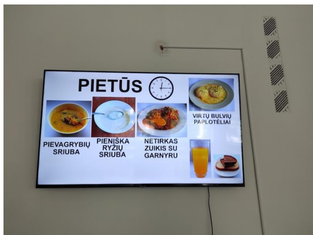
pav. 4 Valgiaraštis.

valgiaraščio taip pat pakabintas rašytinis valgiaraštis dideliu šriftu. Savaitės valgiaraščiai popieriniu variantu buvo pateikiami prie valgyklos įėjimo, o valgykloje dienos valgiaraštis pateiktas dideliame televizoriaus ekrane pirmiau įvardintu paveikslėlių vaizdavimo būdu.