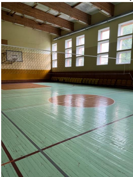
pav. 9 Sporto salė.

Užimtumui skirtose patalpose (siuvyklėlė, medžio drožimo ir pynimo dirbtuvės, dailės užsiėmimų ir keramikos kambariai) buvo užimtumui reikalingas inventorių, jose buvo laikoma daugybė gyventojų padarytų dirbinių. Kultūros namuose įrengtoje šokių (aerobikos) salėje buvo treniruoklių, šalia sporto salės esančiame sandėliuke buvo įvairūs kamuoliai, mobilūs futbolo tinklai, sukimo lankai, teniso stalai, bočios kamuoliukai ir kt. Sporto salė erdvi, joje buvo