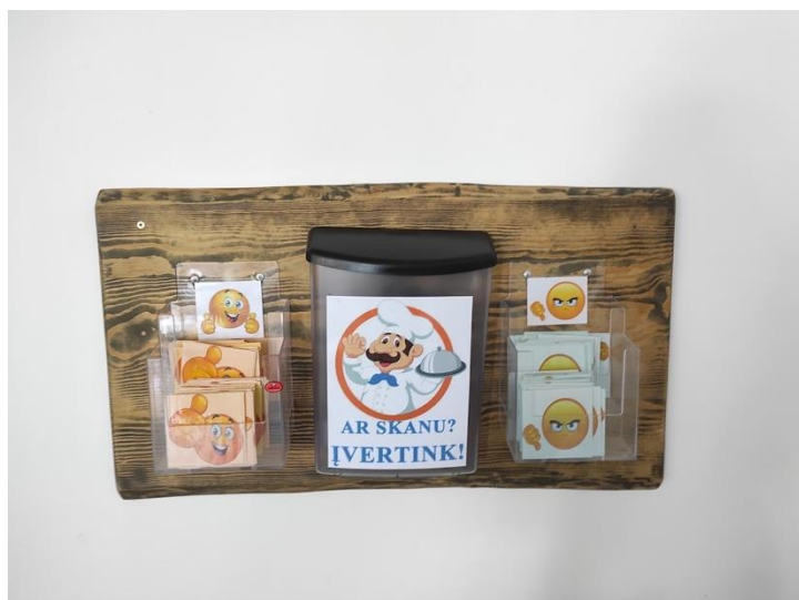
pav. 8 Maisto vertinimo dėžutės.

6.3.10. Vizito metu bendrojoje Globos namų valgykloje gyventojams (-oms) buvo prieinami ir daugelio naudojami visi stalo įrankiai. Globos namų darbuotojų teigimu, gyventojams (-oms), kurie (-ios) neturi ar dėl ligos yra praradę (-usios) įgūdžius naudotis visais stalo įrankiais, siekiama skatinti ir ugdyti įprotį jais naudotis, tačiau dalis gyventojų tokį ugdymą priima su susierzinimu, frustracija. Gyventojams (-oms), valgantiems (-čioms) savo gyvenamuosiuose kambariuose, suteikiami visi stalo