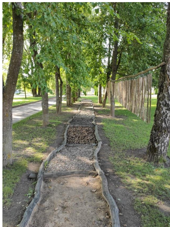
pav. 10 Sensorinis takas.

Užimtumo veiklų savaitiniuose tvarkaraščiuose nurodytomis valandomis dailės, keramikos, medžio drožybos ir pynimo veiklas numatyta vykdyti kiekvieną darbo dieną, kitas menines veiklas (šešėlių teatras, muzikos valandėlės skyriuose, folkloro ir romansų dainavimas, vokalo studija, teatro studija, instrumentiniai ansambliai, mušamųjų instrumentų ritmo grupė, giedorių grupė, meninio skaitymo užsiėmimai) – 1–4 kartus per savaitę. Dviračių sportą numatyta vykdyti 2 kartus per savaitę, tinklinį ir krepšinį – 4 kartus, bočią ir smiginį – 3 kartus, o stalo tenisą, biliardą bei šaškes – kiekvieną darbo dieną. Šiame grafike nurodytu laiku gyventojams (-oms) sudaryta galimybė laisvalaikį leisti bibliotekoje, garsinių knygų skaitykloje, garsinių knygų bibliotekoje,