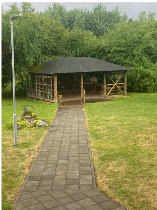
pav. 1 Pavėsinė.

3.3.1.1. Globos namų teritorijoje buvo daug suolelių gyventojams (-oms) prisėsti ir pailsėti, nutiesti takeliai buvo tvarkingi, lygūs, su nuolydžiais. Įrengtos pavėsinės buvo pritaikytos asmenims su judėjimo negalia: pavėsinės erdvios, į visas jas buvo nutiesti takeliai su lygiu nuolydžiu.