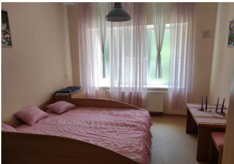
pav. 6 Meilės kambarėlis.

Kalbinti (-os) gyventojai (-os), taip pat ir gyvenantys (-čios) poroje ar palaikantys (-čios) artimus ar intymius santykius su kitu (-a) gyventoju (-a) teigė, kad su jais apie lytinį švietimą ir reprodukcinę sveikatą niekas nekalba, net ir seksualinio smurto prevencijos kontekste.