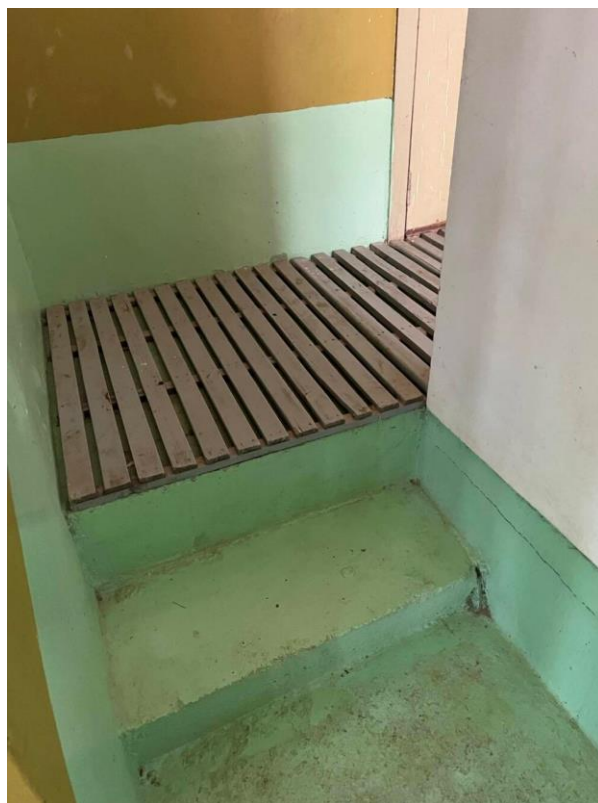
pav. 2 Patekimas į persirengimo kambarį.

3.3.1.11. Globos namų Intensyvios slaugos, II, III ir IV skyriuose asmens higienos patalpos buvo pritaikytos asmenims su judėjimo negalia: sanitarinių mazgų durys bei patalpos yra pakankamo pločio, kad į jas būtų galima įvažiuoti asmenims, besinaudojantiems asmenims su negalia pritaikytu vežimėliu, taip pat tualetuose bei dušuose buvo įrengti ranktūriai. Šiuose skyriuose buvo galimybė naudotis mobiliomis kėdėmis duše. Intensyvios slaugos, II ir III skyrių dušo patalpose buvo su judėjimo negalia gulnčioje pozicijoje esantiems asmenims pritaikytos funkcinės maudymo lovos.