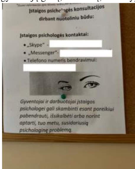
pav. 11 Psichologinė pagalba.

8.3.3. Psichologė pagal kompetenciją konsultuoja gyventojus (-as), taip pat teikia emocinę bei metodinę pagalbą darbuotojams (-oms), o medicinos psichologės pagrindinė funkcija – atlikti gyventojų galių, sunkumų, raidos ypatumų, psichologinių ir asmenybės problemų vertinimą.